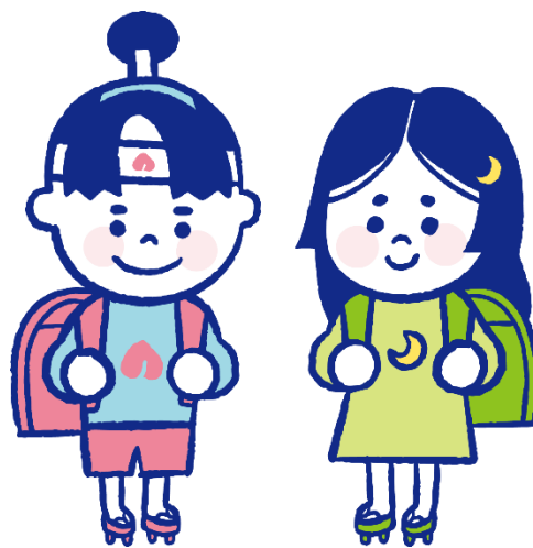
宮崎県の里親制度啓発キャラクター